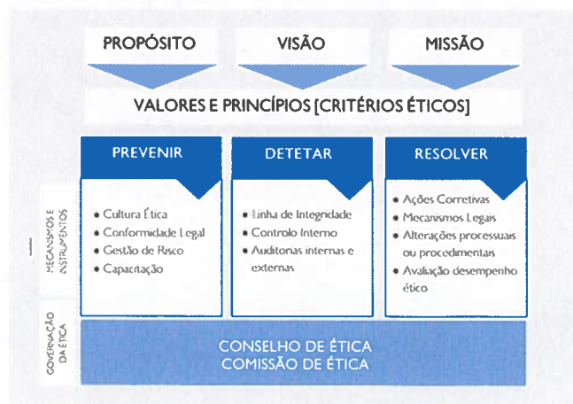
Figura 1 – Modelo de Integridade do Grupo AdP

O eixo " Resolver " integra as medidas a implementar, as metodologias de remediação para garantir a plenitude do modelo e a avaliação do desempenho ético do Grupo AdP através dos indicadores de desempenho ético.